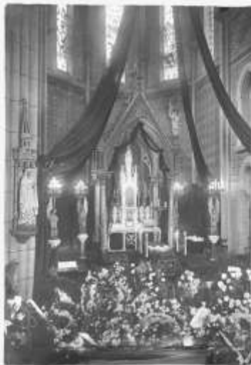
Sprowadzenie prochów H. Sienkiewicza do Ojczyzny, 1924 r.