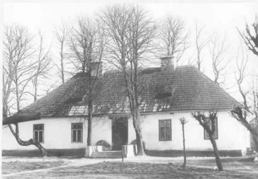
Oficyna dworska w Woli Okrzejskiej, 1929 r.