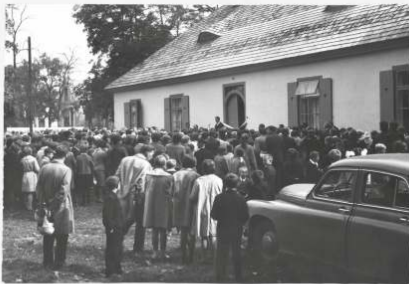
Otwarcie Muzeum Henryka Sienkiewicza w Woli Okrzejskiej, 1966 r.

Muzeum biograficzne Henryka Sienkiewicza otwarte zostało w 120. rocznicę urodzin pisarza. Posiada bogaty zbiór fotografii rodzinnych, osobistych pamiątek po pisarzu jak również unikalny księgozbiór zawierający pierwsze wydania dzieł Henryka Sienkiewicza. Ponadto Muzeum kolekcjonuje wydania krajowe i obcojęzyczne twórczości pisarza z całego świata. Imponujący jest zbiór rekwizytów z ekranizacji filmowych dzieł Noblisty, numizmatycznych jak również kolekcja XIX-wiecznych mebli. Wystawa stała Muzeum prezentowana jest na przestrzeni 6 sal ekspozycyjnych. Ukazuje tradycje rodzinne i związki Henryka Sienkiewicza z Lubelszczyzną, twórczość pisarza, liczne dzieła malarskie, rysunki, grafiki, rzeźby ludowe.