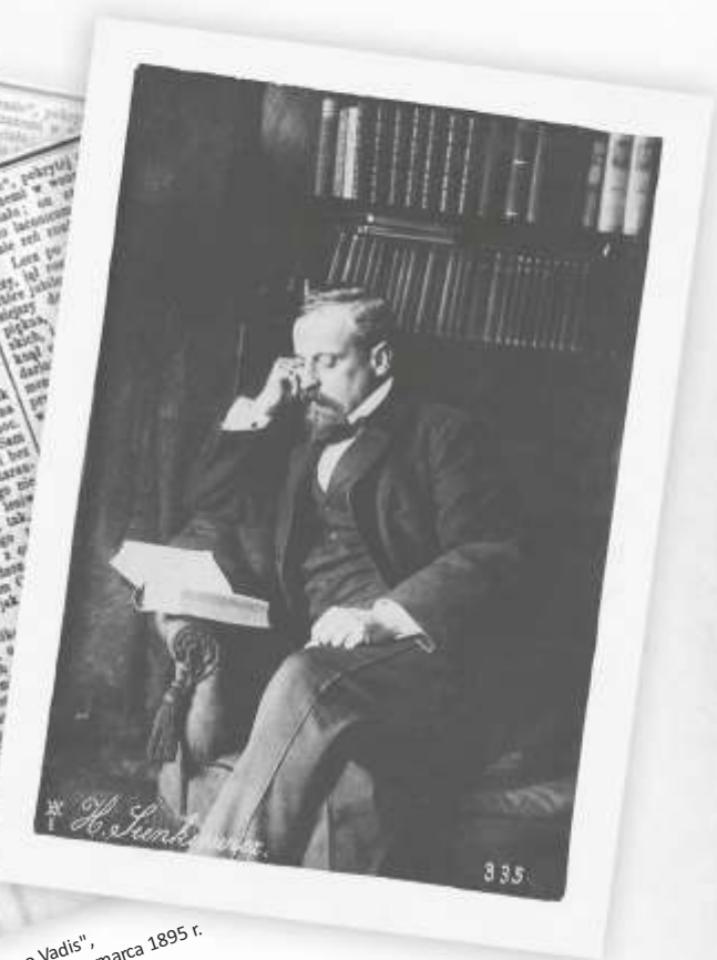
Pierwszy odcinek "Quo Vadis", Dziennik Poznański, nr 73, 29 marca 1895 r.